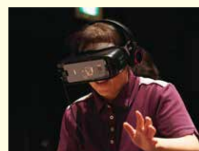
VR認知症体験では、認知症を「我がこと」として体験