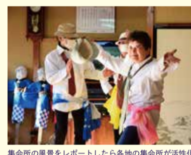
集会所の風景をレポートしたら各地の集会所が活性化

誰もが話題にすることを避けたい「死ぬこと」や「老いること」を楽しく、ふまじめに体験しちゃおうという「フェス」を毎年開催！