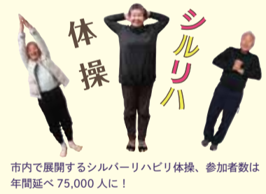
市内で開催するシルバーリハビリ体操、参加者数は年間延べ75,000人！