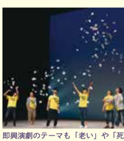
即興演劇のテーマも「若い」や「死」