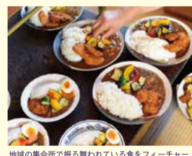
地域の集会所で振る舞われている食をフィーチャー