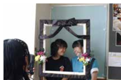
活動を見学に来た他県の高校による「いごくフェス」