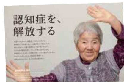
認知症解放宣言ポスター