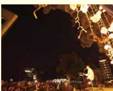
前夜祭では有名歌手もステージに