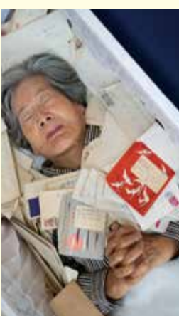
死後の世界から「生」を問い直す入棺体験