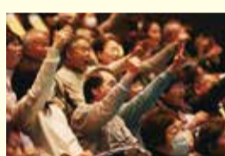
ステージも大盛り上がり