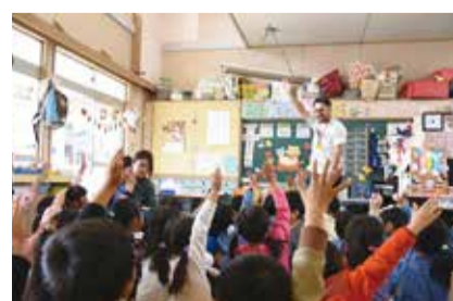
青魚×医療×地域「あいちプロジェクト」