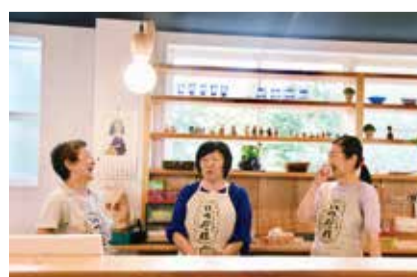
コミュニティ食堂「いっだれキッチン」