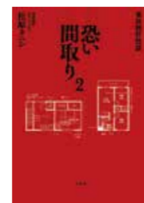
『事故物件怪談 怖い間取り2』 二見書房