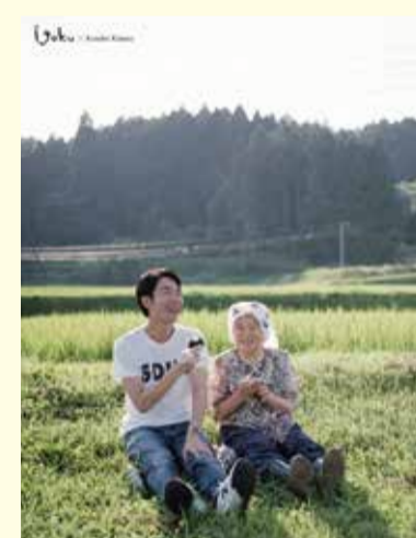
著名写真家とのコラボ作品を露店で展開し話題に