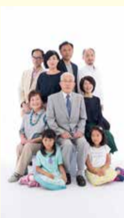
美しい思い出を残すシニアポートレート撮影会