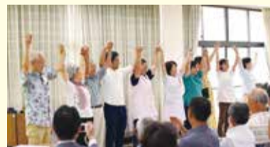
医療や福祉の担い手が、なぜか劇団を結成しよう！