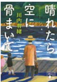
『晴れたら空に骨まいて』川内 有緒 講談社文庫

発つ鳥あとを濁さずの真逆もいいものだ。それは最後の最後まで往生際悪く生き続けようとしてジタバタし続けたカッコいい人生。そうして人生を未完成のままにしておくことで、残された者たちは、閉じなかつた生の痕跡を発見し、もう会えない、触ることができないその人と共に生きていく手がかりを握りしめるのである。