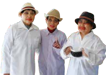
北二区ババアーの会のみなさん 北好間の「好間北二区」集会所のそばに暮らすお母さんたちによるコミュニティデザインユニット。お手製のカカシを地域に展示するなど、近年、アートプロジェクトにも力を入れている。

コロナ禍。豪華なお葬式をやるうと思っただけでも人を集めることが難しい。「感染対策」という大義名分と、「葬式なんてそもそも質素でよかった」という本音とが結びついて、日本中で葬式は簡略化されている。そして、実際、コロナウイルスという危機が目の前にある。家族の負担にならないように、最後の自分の「葬式」の形だけでもある程度決めておきたい。母ちゃんたちは、遺産相続情報でも、延命治療に関する要望でもなく、葬式という極めて現実的な問題からエンディングノートを開こうとしているようだ。